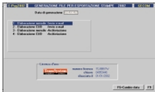
Le scelte disponibili per l'invio o l'archiviazione delle stampe mensili ed annuali